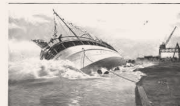
The Launching of the "Delphine" Sideways: When the Yacht Struck the Water It Carried Over to an Angle of 45 Degrees, and Then Righted Backward and Forward for Several Minutes, Rolling High Waves over the Deck, and Sending the Spectators Scouring to Higher and Higher Ground.